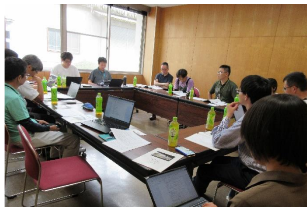
専門家と各部会事務局との協議の様子

遊子川もりあげ隊は、平成23年度から5年ごとに集落づくり計画書を策定し、計画に沿って事業を進めているところです。今年度は、第3次計画書の最終年度にあたり、第4次集落づくり計画書（8～12年度）の策定に取り組むこととなります。当時は遊子川の現状も大分変化しています。